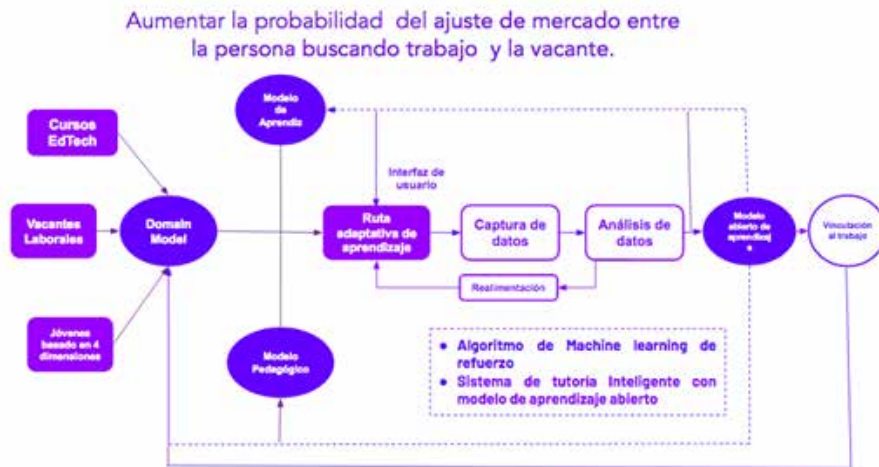
DIAGRAMA 1. MODELO DE AUTOMATIZACIÓN DE RUTAS DE APRENDIZAJE DISRUPTIA